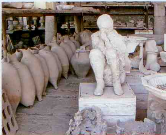
Chcete-li v Neapoli vyrazit na nákupy, navštivte Gallerii Umberto I. Sádrové odlitky lidí ucpávajících si nos jsou nýmým svědectvím zkázy Pompejí. Dobrovolníky venčící psy potkáte i v centru Neapole.