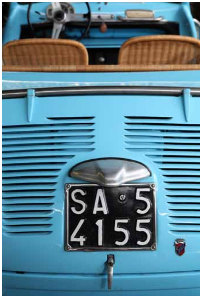
Een oldtimer Fiat 500-cabrio, toeristische hotelspeeltje in Positano.

historische hotel, niet meer dan een riante patriciërs woning met tuin, geniet de reputatie 'the best Grand Hotel in town' te zijn. Alleen al het aperitivo-terras met prachtig uitzicht verdient een ster. In de luwte van de oude cipressen drinken we een glaasje gekoelde limoncello, ver weg van alle piazza-drukke met wildgebarende agenten en dito chauffeurs die om het grote gelijk strijden. Met oogverblindend zicht op de baai bedenken we: als Sorrento een land zou zijn, had het zeer waarschijnlijk een vlag in blauw-en-wit-schakeringen, de kleuren van de zee en de lucht.