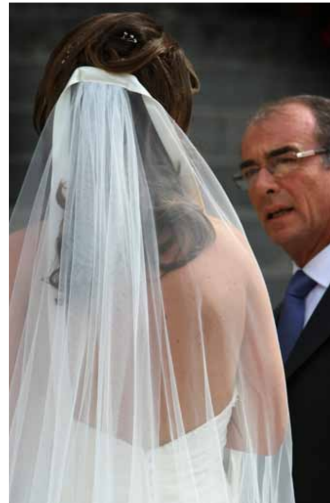
Een Sorrentijns fenomeen zijn de glamoureuze huwelijken. De stad bulkt van de kleine, romantische kerkjes en die zijn zeer regelmatig allemaal uitverkocht.