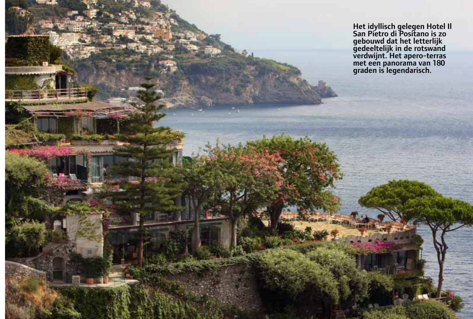
Het idyllisch gelegen Hotel Il San Pietro di Positano is zo gebouwd dat het letterlijk gedeeltelijk in de rotswand verdwijnt. Het apero-terras met een panorama van 180 graden is legendarisch.

van de krantenboer. Vierduizend inwoners, één straat, meer dan honderd hotels. Positano heeft dan misschien door de popularisering van het georganiseerde toerisme wat van zijn authenticiteit – en onschuld – verloren, wanneer we vanop de invalsweg het dorp aanschouwen, weten we meteen waarom we hier zijn. Magnifico! De structuur van dit kliffencollectief is uniek, best te vergelijken met de miniaturdorpjes die naast speelgoedtreintjes gebouwd worden. Dit is een triomf van menselijke vindingrijkheid. Welke richting je ook kiest, uiteindelijk brengen eindeloze reeksen trappen je – zoals in alle Italiaanse dorpen – tot de Duomo, en het nog wat lager gelegen zwarte zandstrand. De drukte en de beperkte oppervlakte maakt het niet de ideale plek om te zonnen, maar met de rug naar de zee krijg je wel een indrukwekkend perspectief voorgeschoteld. Van hieruit zie je de Positano-blokkendoos op z'n best. Al zal ook de zee niet teleurstellen. Volgens de Griekse mythologie zongen de sirenes zo mooi op Li Galli, de rotsachtige uitstulping vlak voor de kust van Positano, dat Odysseus de oren van zijn bemanning en van zichzelf dichtstopte met was en zichzelf vastbond aan de mast om aan hun verleiding te weerstaan.