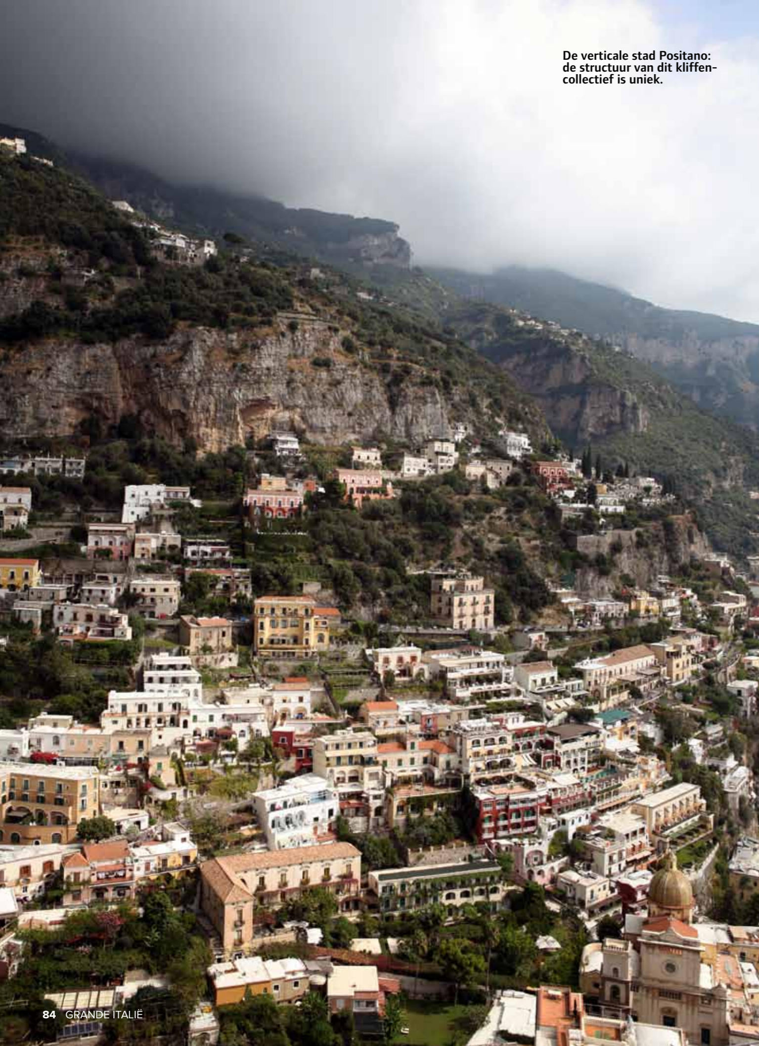
De verticale stad Positano: de structuur van dit kliffen-collectief is uniek.