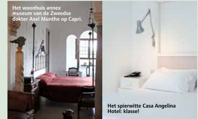
Het woonhuis annex museum van de Zweedse dokter Axel Munthe op Capri.

hier is de luxewind langzaam maar zeker te dikwijls overgevlogen. Geen nood, er is een cultureel alternatief. We bezoeken de Villa San Michele, woonhuis annex museum van de Zweedse dokter Axel Munthe. Geboren in 1857 studeerde hij in Frankrijk en reisde hij in 1884 naar Napels om er te helpen bij het bestrijden van de pest. In 1893 werd hij privé-arts van kroonprinses Victoria van Zweden. Dat mondde uit in een relatie en het koppel trok zich terug op Capri. Victoria stierf in 1930, Dokter Munthe in 1949. Munthe was zich met de jaren meer met literatuur gaan bezighouden en schreef ook veel over het leven op z'n geliefde Capri. Over zichzelf pende hij neer: "Ik was geen goed dokter, maar een succesvol dokter." Naast het museumaspect willen de reizigers vooral z'n tuin bezoeken, een juweeltje dat uitloopt op een pergola die hoog boven de zee uittorent. Omdat één ritje met de taxi der taxi's al duur genoeg was, besluiten we om met het openbaar vervoer terug naar de haven te bollen. We komen in een piepkleine stadsbus terecht waar de chauffeur – om z'n hoofdzakelijk Franse gasten te plezieren – de wereldhit 'Capri c'est fini' van Hervé Vilard uit 1965 loeihard uit de boxen laat galmen. Gecharmeerd door de meezinger – er werden meer dan 2,5 miljoen exemplaren van verkocht – lippen we mee terwijl buiten langzaam de zon ondergaat. 'Capri, c'est fini, et dire que c'était la ville de mon premier amour...'