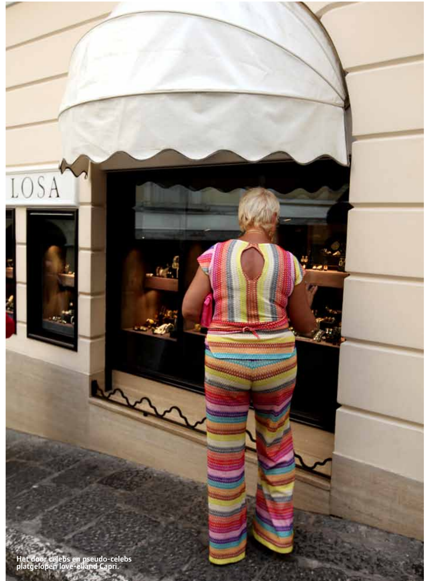
Het door celebs en pseudo-celebs platgelopen love-eiland Capri.